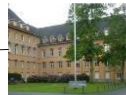
ArL Weser-Ems Oldenburg